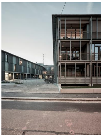
Lotissement Maiengasse à Bâle

Tous les trois ans le Prix Lignum récompense les meilleures prestations en bois, du meuble aux ensembles résidentiels en passant par les aménagements intérieurs. Parmi les 15 projets primés issus des cinq régions de Suisse, un jury a décerné trois prix nationaux : Or, Argent et Bronze. L'Or 2021 couronne ainsi le lotissement empli de virtuosité Maiengasse à Bâle, tandis que l'Argent échoit au Centre agricole de Saint-Gall à Salez, exemplaire et durable. Le Bronze a quant à lui été attribué à une surélévation à Vevey qui fait office de jalon pour tout un quartier. Un meuble d'une astucieuse simplicité et un aménagement intérieur abouti à plus d'un titre, reçoivent la première édition du Prix spécial menuiserie.