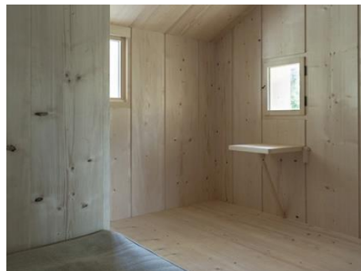
Transformation d'un alpage à St Antönien