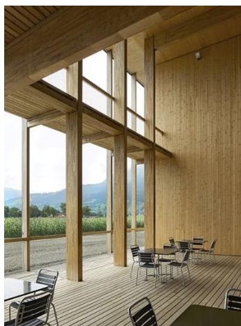
Centre agricole à Salez