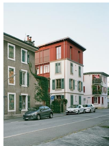
Surélévation à Vevey